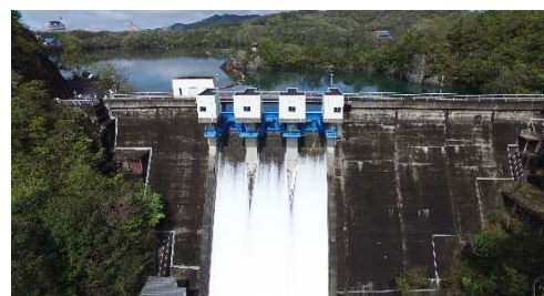
普段は上部よりの放流はございません。